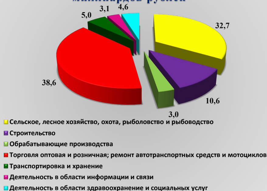
Рис. 1. Оборот организаций по видам экономической деятельности за первое полугодие 2022 года, млрд. рублей