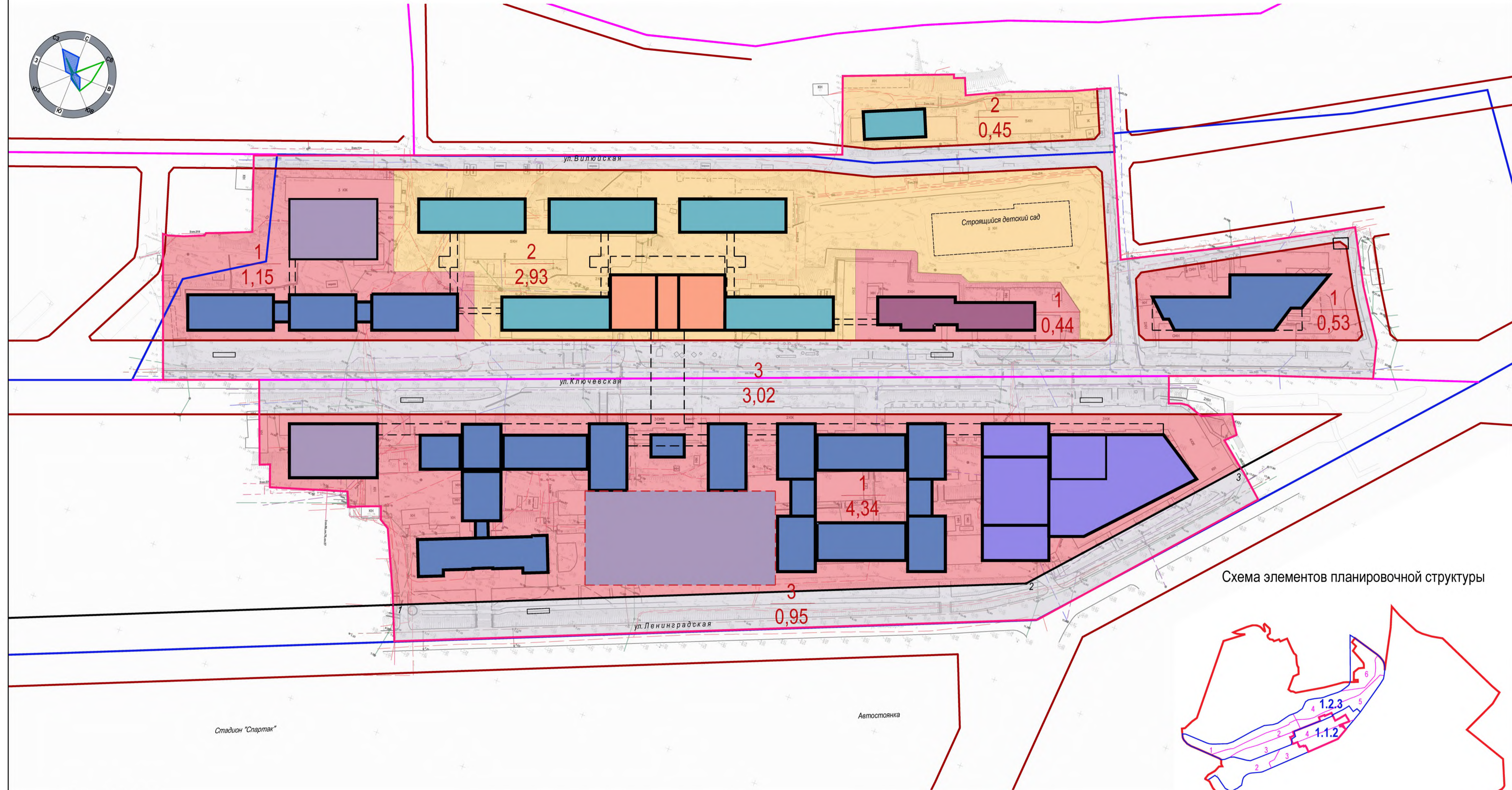
Схема элементов планировочной структуры