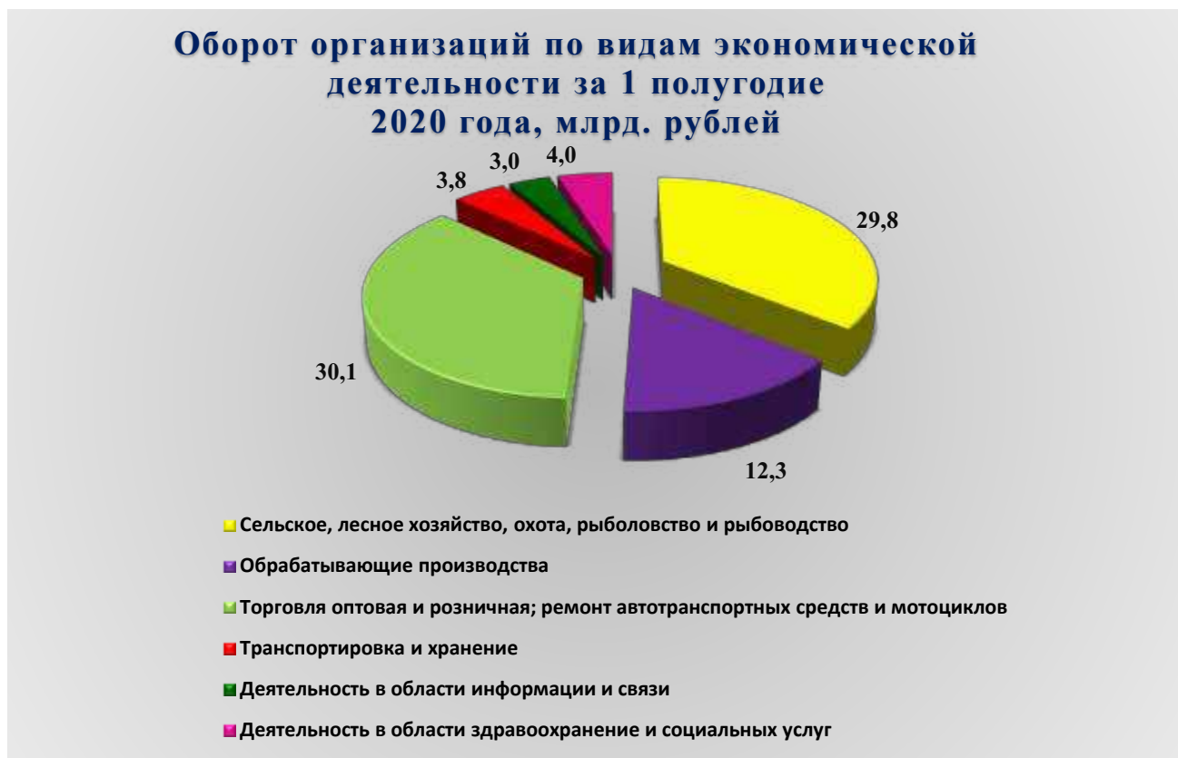
Рис. 1. Оборот организаций по видам экономической деятельности за 1 полугодие 2020 года, млрд. рублей

В январе - июне 2020 года оборот организаций Петропавловск-Камчатского городского округа по всем видам экономической деятельности в действующих ценах составил 93 180,5 млн. рублей, что в действующих ценах на 19,0 % выше уровня аналогичного периода предыдущего года. Из общего объема оборота организаций на долю организаций сельского, лесного хозяйства, охоты, рыболовства и рыбоводства приходится 32,0 %; на долю организаций оптовой и розничной торговли, ремонта автотранспортных средств и мотоциклов – 32,3 %; на организации обрабатывающих производств – 13,2 %.