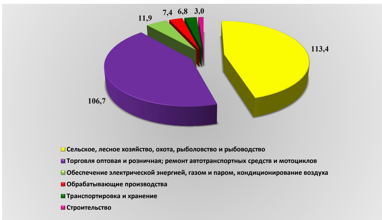
Рис. 1. Оборот организаций по видам экономической деятельности за 2023 год, млрд. рублей

Оборот организаций по видам экономической деятельности за 2023 год представлен на рисунке (далее – рис.) 1.