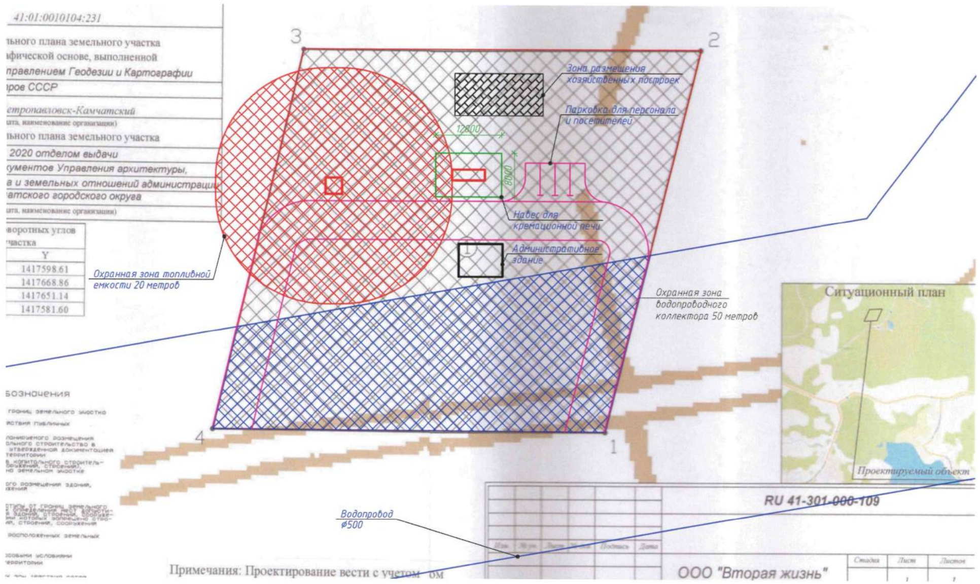
Схема неблагоприятных факторов представлена на фрагменте градостроительного плана земельного участка совместно с предполагаемой схемой размещения объектов.