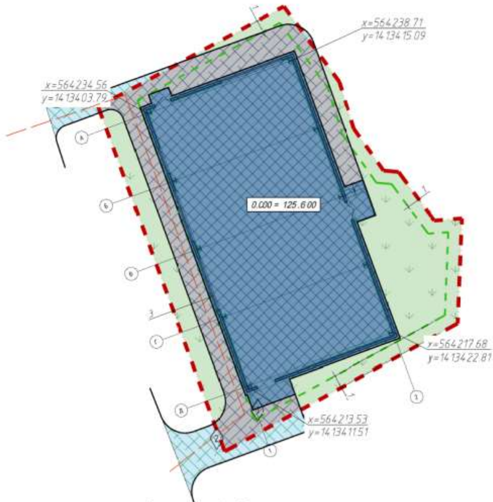
Схема устройства покрытия проездов и тротуаров