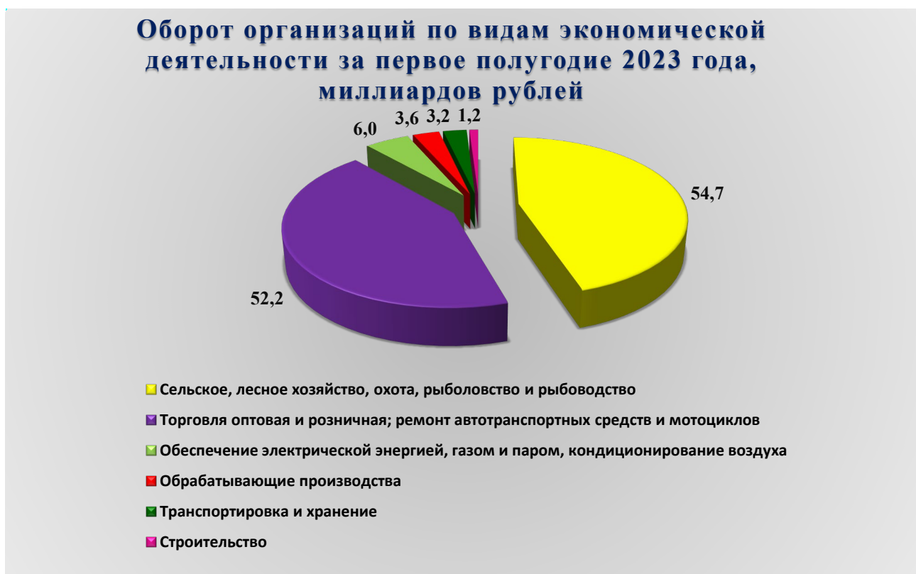
Рис. 1. Оборот организаций по видам экономической деятельности за первое полугодие 2023 года, млрд. рублей

В январе – июне 2023 года оборот организаций городского округа по всем видам экономической деятельности в действующих ценах составил 136 853,200 миллиона (далее – млн.) рублей, что на 5,0 % выше уровня аналогичного периода предыдущего года. Из общего объема оборота организаций на долю организаций сельского, лесного хозяйства, охоты, рыболовства и рыбоводства приходится 40,0 %, на долю организаций оптовой и розничной торговли, ремонта автотранспортных средств и мотоциклов – 38,1 %, на долю организаций, занимающихся обеспечением электрической энергией, газом и паром, кондиционированием воздуха – 4,4 %, на долю обрабатывающих производств – 2,7 %, на долю организаций, занимающихся транспортировкой и хранением – 2,4 %, на долю строительных организаций – 0,9 %.