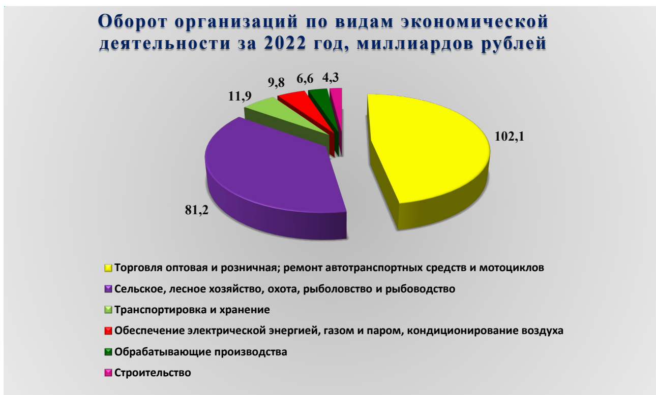
Рис. 1. Оборот организаций по видам экономической деятельности за 2022 год, млрд. рублей

В 2022 году оборот организаций городского округа по всем видам экономической деятельности в действующих ценах составил 250 546,700 миллиона (далее – млн.) рублей, что на 13,8 % выше уровня предыдущего года. Из общего объема оборота организаций на долю организаций оптовой и розничной торговли, ремонта автотранспортных средств и мотоциклов приходится 40,7 %, на долю организаций сельского, лесного хозяйства, охоты, рыболовства и рыбоводства приходится 32,4 %, на долю организаций, занимающихся транспортировкой и хранением – 4,8 %, на долю организаций, занимающихся обеспечением электрической энергией, газом и паром, кондиционированием воздуха – 3,9 %, на долю обрабатывающих производств – 2,6 %, на долю строительных организаций – 1,7 %.